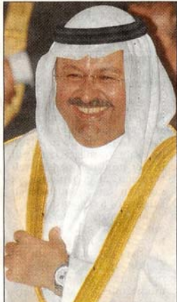
GHAZI AL-YAWAR - Iraks nye præsident mener, at det er nødvendigt, at koalitionsstyrkerne bliver i Irak.

Er du fyldt 55 år, får du 15% i seniorrabat på bl.a. din Bilforsikring Ring 70 10 29 44 Nykredit Alt du kan eje